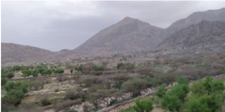
صورة من الغطاء النباتي بقرية السودة، مديرية الجوبة